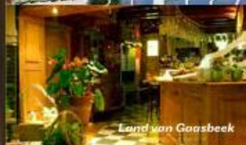
Land van Gaasbeek