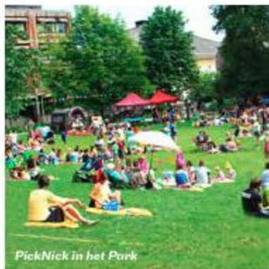
PickNick in het Park

leidt je via de autovrije jaagpaden van het Kanaal Leuven-Dijle helemaal tot in Tremelo, Kampenhout en Werchter. Bezoek het Damiaanmuseum en het belevingscentrum Rock Werchter X. De route Prinsheerlijk van Leuven naar Tervuren (48 km) volgt de Dijlevallei naar prinselijke kastelen en het koninklijke Africamuseum in Tervuren. Duik van de stad het bos in (31 km) gaat het groen van het Heverleebos en Meerdaalwoud in. Daar leven de kinderen zich uit op de gekste klim- en klautertuigen.