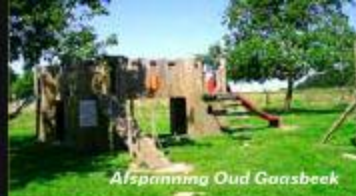
Afspanning Oud Gaasbeek