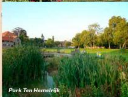
Park Ten Hemelrijk